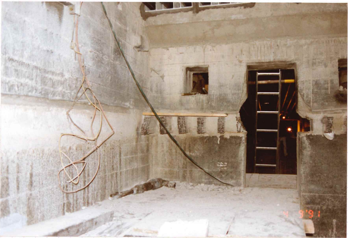
La situation des anciens cables au niveau de l'entree de l'IS.