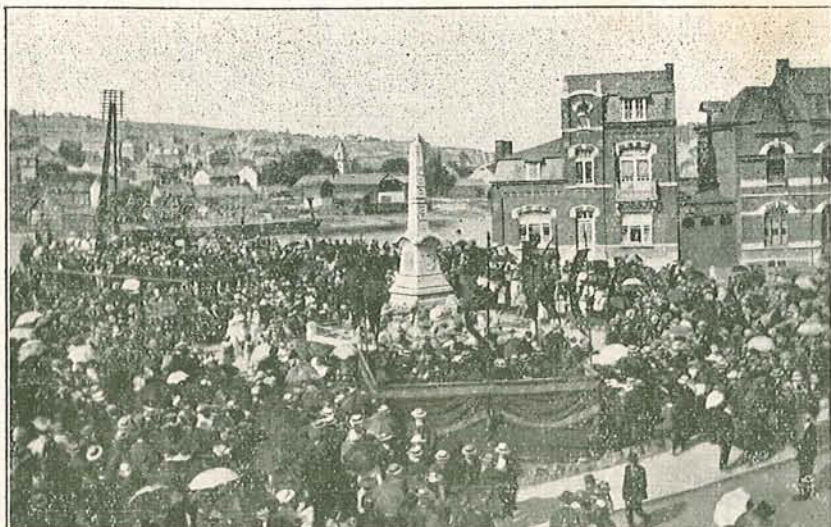
La Fête Patriotique à Thon-Samson