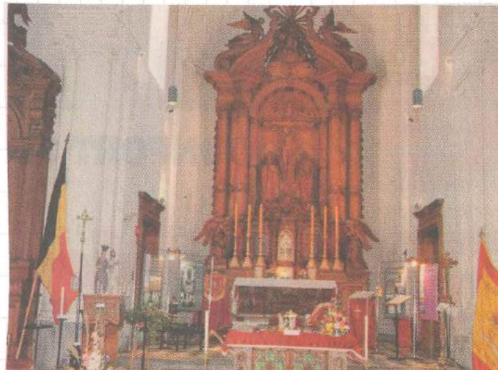
Le c(h)œur de l'exposition